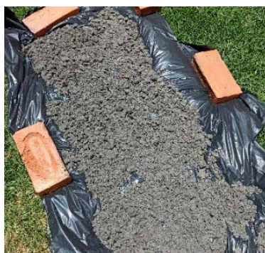
FIGURA 1. Resíduo de Marmoraria durante o processo de secagem.

O processo de produção da cinza iniciou com a secagem do material durante 72 horas de exposição do material a céu aberto, conforme mostra a Figura 1, de tal forma a garantir os procedimentos de peneiramento granulométrico conforme NBR 17054 (ABNT, 2022). Em seguida, o material foi destorroado manualmente e acondicionado em recipientes, passando por um processo de peneiramento granulométrico.