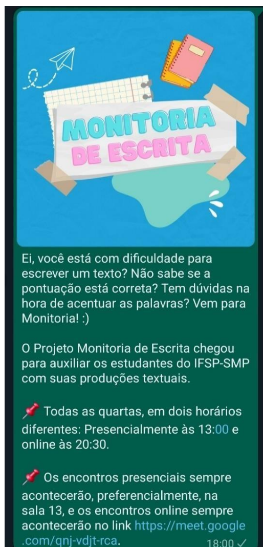
Figura 3: Divulgação feita pelo WhatsApp