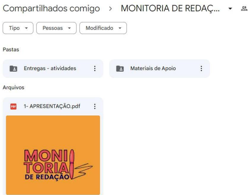
Figura 1: Drive da Monitoria

Esta iniciativa possui caráter duradouro já que uma das frentes é a produção de um repositório para os futuros estudantes. Todos os materiais desenvolvidos para a Monitoria são adicionados a uma pasta do Google Drive, onde todos os estudantes do Campus , participantes ou não, podem acessar para fins de estudos e aperfeiçoamento das habilidades escritas. Assim, os futuros alunos também poderão ter acesso ao que já foi e ao que vem sendo desenvolvido neste projeto. Cabe ressaltar que a produção de materiais começou em 2021 por iniciativa dos próprios estudantes, continuou em 2022 por meio de um projeto de ensino aprovado com bolsa, e os materiais continuam a ser desenvolvidos e complementados neste ano. A divulgação da Monitoria é feita nos grupos de WhatsApp e por meio de cartazes, que são colados pela escola, como mostrado a seguir: