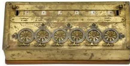
FIGURA 3. Pascalina. 3

pascalina exclui esse processo manual de manipulação, graças ao seu sistema de engrenagens, para adicionar 5 a 6, por exemplo, basta girar a roda das unidades em seis dentes e ela representará o dígito 6 nas unidades, em seguida, basta girar a roda das unidades mais cinco dentes, que ela apresenta 1 nas dezenas e 1 nas unidades, representado o número 11.