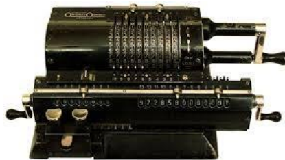
FIGURA 4. Aritmômetro 4

Sucedendo a pascalina, desenvolveram-se várias máquinas de calcular. Algumas delas são o aritmômetro de Thomas de Colmar (1785 - 1870), a máquina de multiplicar de Léon Bollée (1870 - 1913), o contômetro de Dorr E. Felt (1862 - 1930) e o mecanismo de maior sucesso, foi um modelo de aritmômetro desenvolvido na Rússia (FIGURA 4), pelo engenheiro sueco Willgodt Theophil Odhner (1845 - 1905).