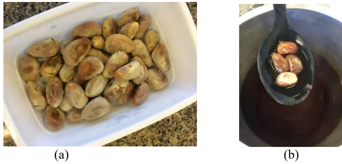
FIGURA 1. Sementes de jaca dura cruas (a) e cozidas (b).