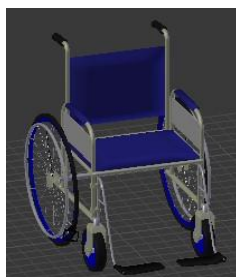
FIGURA 1. Virtualização da cadeira de rodas utilizada na simulação

Na figura 1 está representada a virtualização da cadeira de rodas que foi modelada e desenvolvida no Blender (2017).